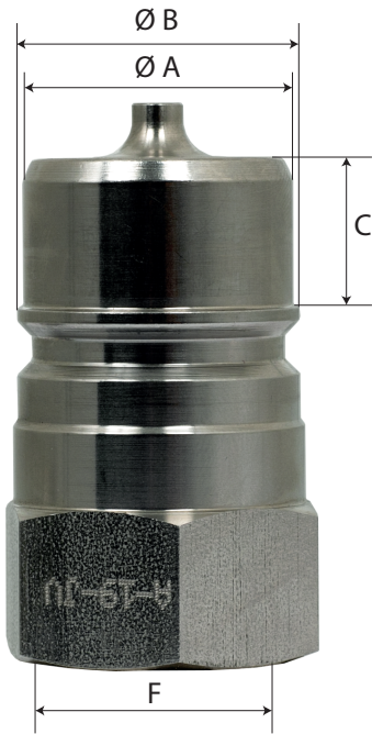
ISO 7241 A

Het is soms lastig het verschil tussen een ISO 7241 A en ISO 7241 B steeknippel op te maken. Om de identificatie te vereenvoudigen, hierbij een maatvoeringstabel van beide versies. Als eenmaal duidelijk is welk profielsoort u nodig heeft, kunt u via onze website de productcodes opzoeken.